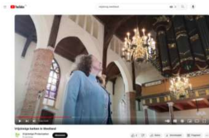
Vrijzinnig Westland (Zuid-Holland) nam een video op waarin wordt uitgelegd waar de vrijzinnigheid voor staat. De video is te vinden op YouTube.