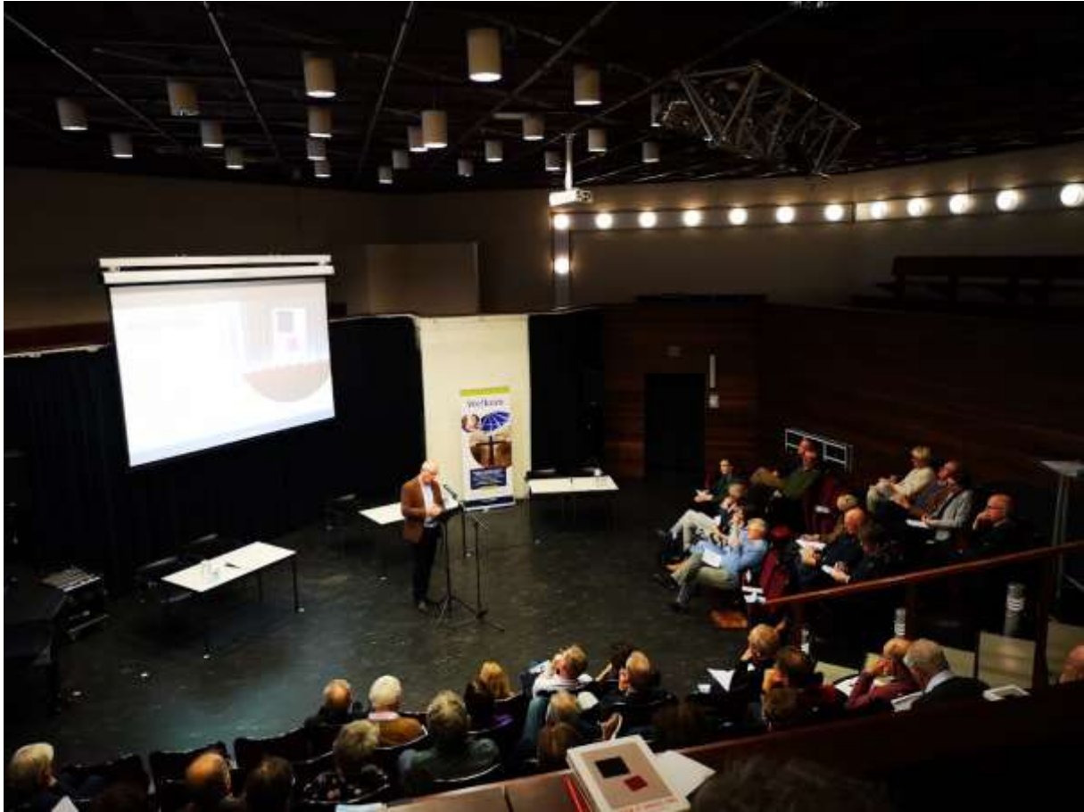
Foto boven: studiedag rondom het boek 'Boven is onder ons' (zie onder) in de Thomaskerk in Amsterdam.